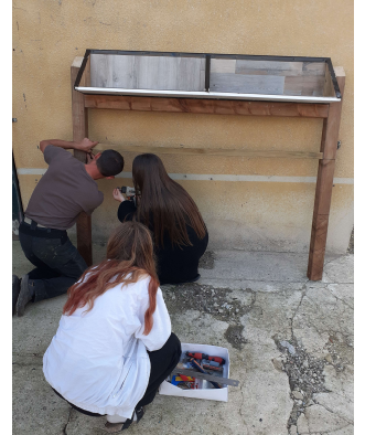
La famille Baudoin en plein montage

Venez nombreux pour participer à cette belle création !